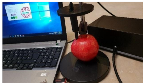
شکل ۶- سامانه اپتیکی تشخیص سریع و غیرمخرب آفت کرم گلوگاه انار مبتنی بر طیف‌سنجی مرئی/فروسرخ نزدیک [۲۷]

به عنوان یک نمونه دیگر، سامانه اپتیکی توسعه یافته بر پایه طیف‌سنجی مرئی/فروسرخ نزدیک برای تشخیص سریع و غیرمخرب آفت درونی کرم گلوگاه انار و خسارت‌های ناشی از آن در مراحل اولیه رشد و بدون علائم ظاهری با قابلیت شناسایی محصول سالم از ناسالم مبتنی بر مدل‌های تشخیص الگو قابل ذکر است (شکل ۶). این سامانه نیز شامل یک بخش سنجش طیفی مبتنی بر دو شیوه اپتیکی، مدل-های شناسایی انار سالم از آلوده (که برای یک جامعه آماری انار سالم و آلوده شده به صورت مصنوعی به لارو آفت در مراحل مختلف رشد) تدوین و اعتبارسنجی شده، و یک رابط گرافیکی کاربر مبتنی بر مدل‌های تشخیص است. دقت این سامانه برای تفکیک انارهای سالم از آلوده (رقم ملیس ساوه) ۹۰ درصد است [۲۶ و ۲۷].