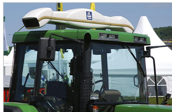
شکل ۴- سامانه هوشمند مبتنی بر طیف‌سنجی برای کیفیت‌سنجی گیاه یا محصول از نظر عناصر تغذیه‌ای و توزیع کود متناسب با نیاز تغذیه‌ای [۴]

شکل ۴ یک سامانه هوشمند سنسجش کیفیت گیاه یا محصول را بر اساس عناصر تغذیه‌ای آن را نشان می‌دهد که در آن، یک هد حسگر مبتنی بر طیف‌سنجی بازتابی فرورسرخ نزدیک بالای تراکتوری که کودپاش به آن متصل است، نصب شده است. این سامانه که به صورت تجاری نیز درآمده