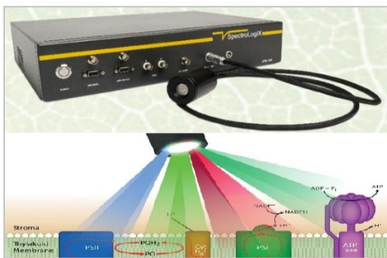
شکل ۱- اسپکترومتر هوشمند فتوسنتز [۵]

به عنوان یک نمونه بارز دیگر می توان به نوعی از دیودهای نشر نور ۴ (LED) هوشمند اشاره کرد که کنترل انرژی را تسهیل و خودکارسازی را در فضاهای بسته کشاورزی امکان پذیر می کنند (شکل ۲). به این ترتیب، با استفاده از فناوری اینترنت اشیا و استفاده از LEDهای هوشمند مبتنی بر فناوری طیفسنجی غیرمخرب در کنار سایر حسگرها، به عنوان مثال در یک گلخانه، امکان نظارت و کنترل نور LED، مقدار CO 2 ، رطوبت، سلامت گیاهان و تجزیه و تحلیل داده ها برای حفظ یک محیط پایدار به وجود می آید. بر این اساس، می توان انتظار عملکرد ۱۰ برابری نسبت به یک محیط باز سنتی داشت [۶].