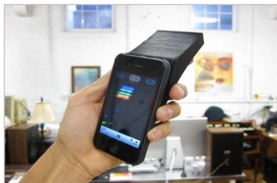
شکل ۳- اسپکترومتر تلفن همراه هوشمند [۱۱]

شکل ۳ یک نمونه اسپکترومتر تلفن همراه هوشمند را نشان می‌دهد که به راحتی با یک گوشی تلفن همراه و طیف‌سنجی در ناحیه قرمز، سبز و آبی می‌تواند مشکلات مختلفی را در گیاه یا محصول (از نظر کیفیت، ایمنی و سلامت) تشخیص دهد [۱۱].