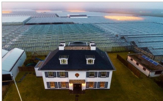
شکل ۲- خودکارسازی گلخانه ها با LEDهای هوشمند [۶]

به طور کلی، اسپکترومترها و سامانه های طیفی هوشمند (مبتنی بر آزمون غیرمخرب طیفسنجی) در محیط های گلخانه ای برای بررسی ویژگی های طیفی نور مصنوعی و بهینه سازی ترکیب های نوری، همچنین کنترل خودکار سامانه های روشنایی هوشمند مبتنی بر LEDها که نور را