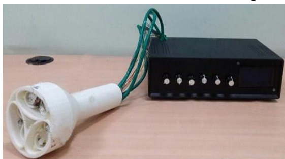
شکل ۷- سامانه هوشمند تعیین غیرمخرب رسیدگی سیب مبتنی بر اطلاعات طیف‌سنجی مرئی/فروسرخ نزدیک [۲۸]

به عنوان یک نمونه بارز در این زمینه کاربرد، می‌توان به ربات هوشمند مبتنی بر طیف‌سنجی فروسرخ نزدیک اشاره کرد که توانایی برداشت محصول انبه را متناسب با تشخیص میزان رسیدگی بر پایه مدل‌های پیش‌بینی‌کننده هوشمند تدوین شده بر اساس اطلاعات طیفی محصول در ناحیه فروسرخ نزدیک دارد [۲۹].