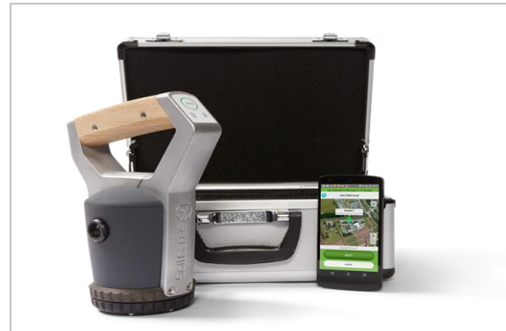
شکل ۸- اسکنر دستی هوشمند مبتنی بر طیف‌سنجی فروسرخ نزدیک و اپلیکیشن تلفن همراه [۳۲]

به عنوان یک نمونه بارز می‌توان به اسکنر دستی هوشمند مبتنی بر فناوری طیف‌سنجی فروسرخ نزدیک برای کیفیت‌سنجی غیرمخرب خاک اشاره کرد (شکل ۸).